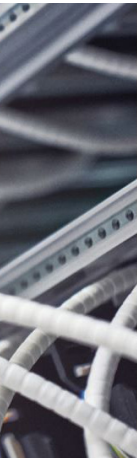
■ 第一線東京 POP 機房內部跳線盤。 第一線東京 POP 機房內部伺服器。