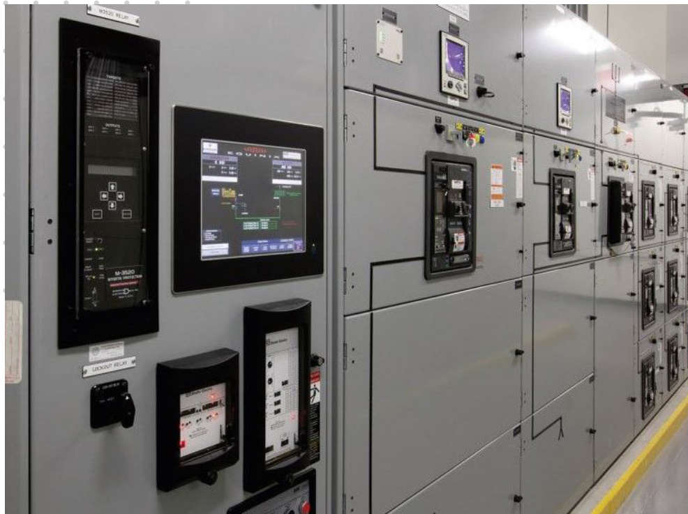
■ 第一線東京 POP 機房內部機電基礎設施一隅。

正所謂天下武功、唯快不破，現今企業欲加快數位轉型進程，及早開拓新與市場、催生創新服務，顯然不適合採取傳統自建機房模式、一磚一瓦慢慢肇建 IT 基礎設施，唯有充份善用中立機房已臻成熟穩固的基礎環境，才是加快商業佈局的理想做法。今年 (2020) 第一線成功而快速地打造東京 POP 機房之例，為值得借鏡的範本。